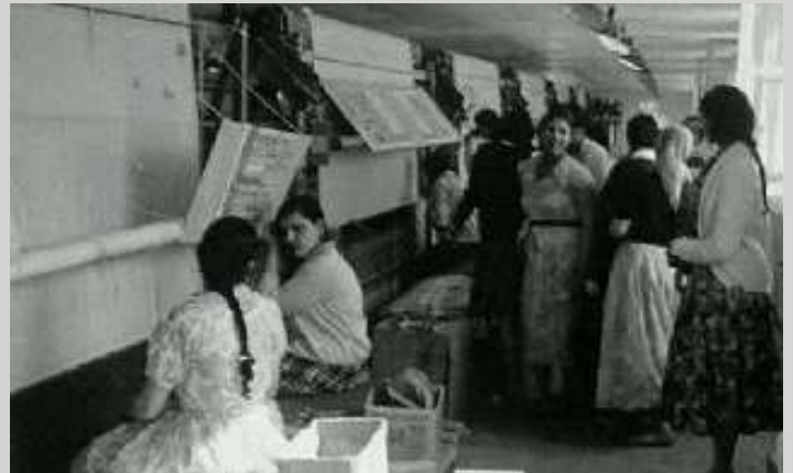
Licières à l'atelier de Lodève, 16.05.1966

Cette « désertion », en partie liée au départ en retraite de la première génération, interroge néanmoins la construction d'une mémoire et d'un oubli d'État qui met de côté la valeur patrimoniale du travail fourni par ces femmes. Par la double entrée de l'objet tapis et des trajectoires, l'analyse s'attardera sur les manifestations de ce silence d'État et notamment sur la (non) patrimonialisation des tapis de Lodève.