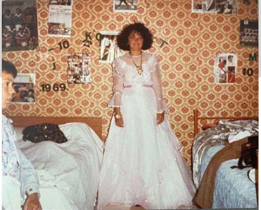
Archive privée, photographie d'une fiancée, descendante de harkis, à son domicile, le jour de ces noces, août 1985.

Alors que la plupart des recherches sur les harkis de Mas-Thibert se focalisent sur l'histoire largement médiatisée du Bachaga, ma communication met l'accent sur les intimités et les conjugalités des familles des anciens supplétifs dans deux zones géographiques proches et pourtant distinctes : la Cité du Mazet et Mas-Thibert.