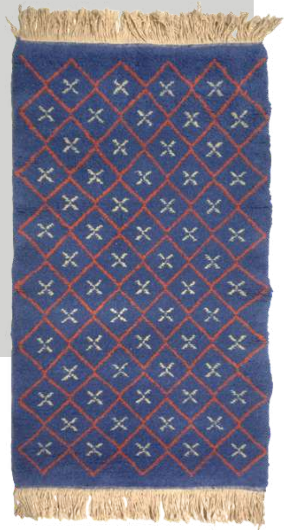
Tapis de Lodève, 1964, laine et coton, Paris, Mobilier national.

Alors que les récits des femmes de harkis trouvent progressivement un écho dans la société française, leur mémoire est « mise en sourdine » par le gouvernement français. À partir du cas des licières de l'atelier de Lodève, l'objectif de cette contribution est de questionner ce silence d'État qui participe à la constitution d'une mémoire institutionnalisée. « Rapatrié » par un industriel de Tlemcen, l'atelier de Lodève est fondé en 1962 pour accueillir les femmes de harkis arrivées dans la région à la suite des accords d'Évian[2].