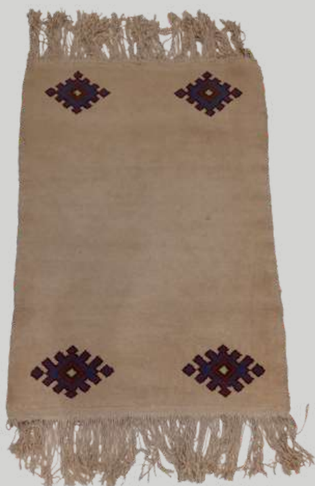
Tapis de Lodève, 1964, laine et coton, Paris, Mobilier national.